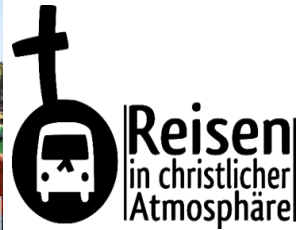
Marsch für das Leben: Für eine lebensbejahende Gesellschaft

Abfahrten: 5 h FO (St.Johannis, Zweibrücken- 40) 5.20 h EBS (DM-Markt)-5.30 h Hlg.stadt (Bürgerhaus) 6.20 h BT (Oberfrankenhalle) - 7 h Münchberg (A9-Rasthof). Weitere Zustiege nur nach Absprache!